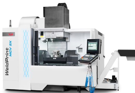
Hybridní stroj pro additive manufacturing

Virtuální prohlídka laboratoří RCMT a IPA